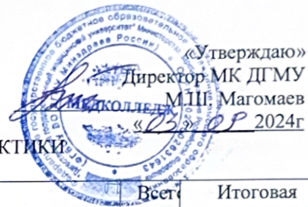
ГРАФИК ПРОХОЖДЕНИЯ ПРОИЗВОДСТВЕННОЙ/УЧЕБНОЙ ПРАКТИКИ 34.02.01. СЕСТРИНСКОЕ ДЕЛО