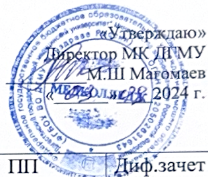
ГРАФИК ПРОХОЖДЕНИЯ УЧЕБНОЙ И ПРОИЗВОДСТВЕННОЙ ПРАКТИКИ СПЕЦИАЛЬНОСТЬ 31.02.05. СТОМАТОЛОГИЯ ОРТОПЕДИЧЕСКАЯ