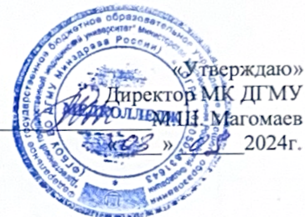
ГРАФИК ПРОХОЖДЕНИЯ ПРОИЗВОДСТВЕННОЙ/УЧЕБНОЙ ПРАКТИКИ СПЕЦИАЛЬНОСТЬ 31.02.01. ЛЕЧЕБНОЕ ДЕЛО