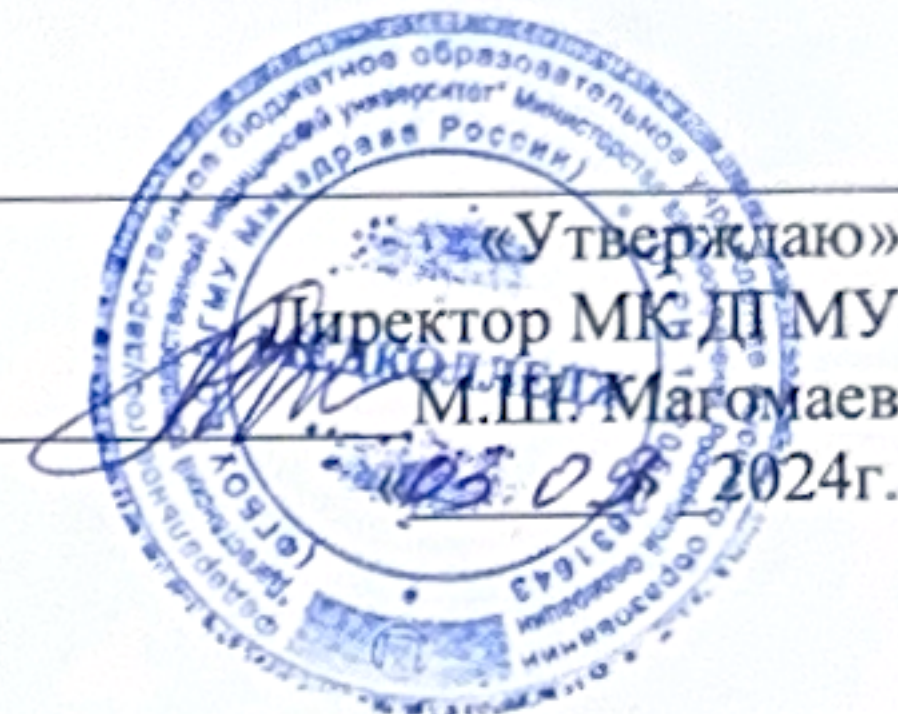
ГРАФИК ПРОХОЖДЕНИЯ ПРОИЗВОДСТВЕННОЙ/УЧЕБНОЙ ПРАКТИКИ СПЕЦИАЛЬНОСТЬ, 31.02.02. АКУШЕРСКОЕ ДЕЛО